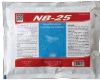
MEN VI SINH CAO CẤP XỬ LÝ AO Ô NHIÊM