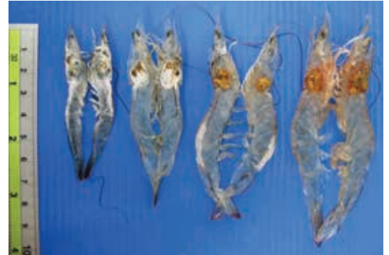
Vi bào tử trùng gây bệnh tôm bông