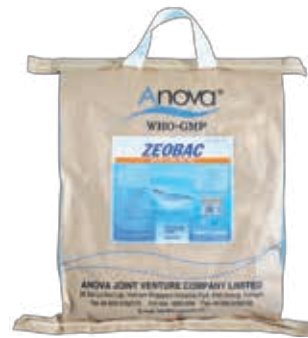
MEN VI SINH XỬ LÝ ĐÁY AO